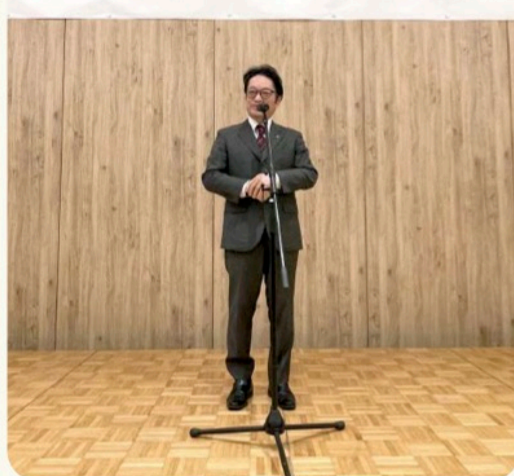
令和5年度 医療法人社団 順幸会 阿蘇立野病院