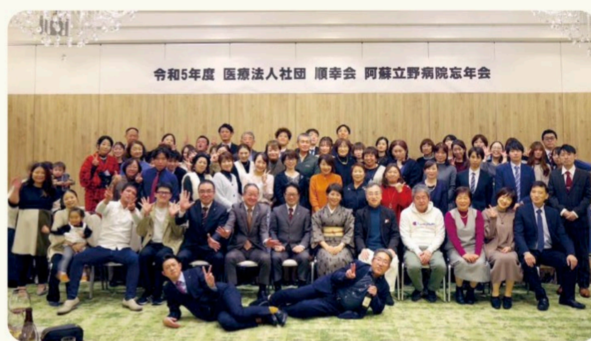
令和5年度 医療法人社団 順幸会 阿蘇立野病院忘年会