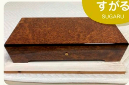
通所リハビリテーションセンター すがる SUGARU